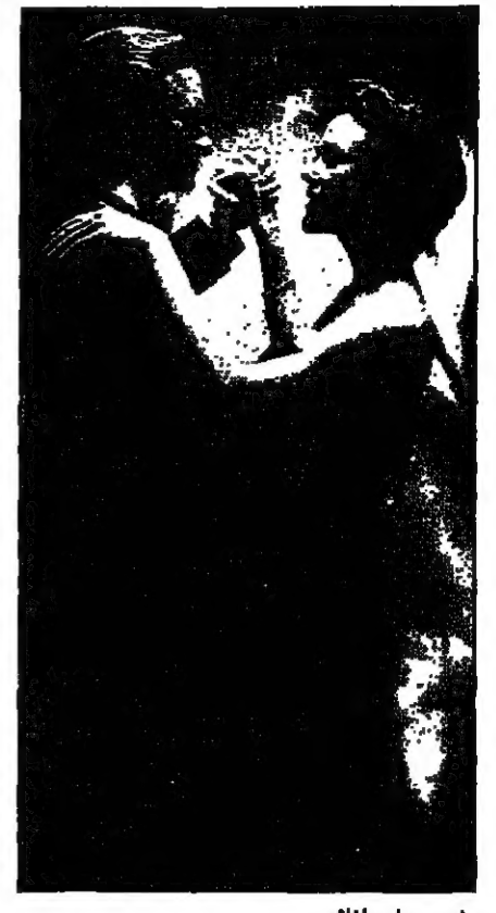
مشهد من احد افلامه